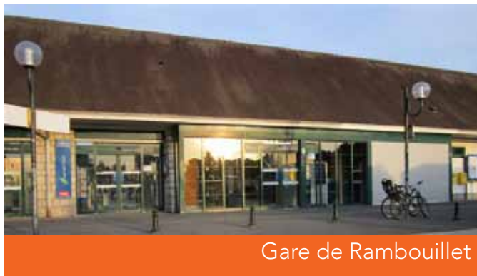
Gare de Rambouillet