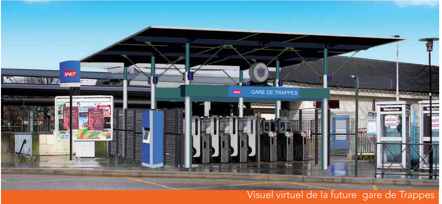
Visuel virtuel de la future gare de Trappes

D'ici fin 2012, les deux accès à la gare de Trappes vous offriront un nouveau visage !