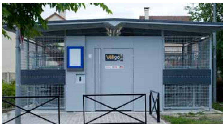
Station véligo de Trappes

N'attendez pas pour vous inscrire, le nombre de places est limité.