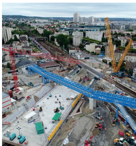
La dalle avant d'être ripée

Durant 100 heures du 12 au 15 août, les équipes sur le chantier de la gare de Clamart ont glissé le toit de 7 000 tonnes de la future gare Fort d'Issy-Vanves-Clamart de la ligne 15 du Grand Paris Express sous les voies de la